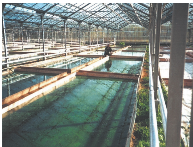
Рис. 2. Апробация технологии НИЛ ВИЭ по выращиванию микроводорослей/цианобактерий артроспиры/спирулины в тепличных комплексах Московской области

Выделенные в процессе первичного скрининга кандидатные штаммы микроводорослей составили основу постоянно пополняющейся коллекции. Выделение из природной среды микроводорослей-продуцентов липидов проводили на основе окрашивания клеток МКВ различными красителями: суданами и специфическим на нейтральные липиды флуоресцентным красителем Нильским красным с последующей регистрацией в люминесцентном микроскопе.